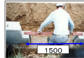
間隔定規の使い方