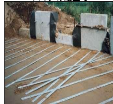
ストリップの敷設状況