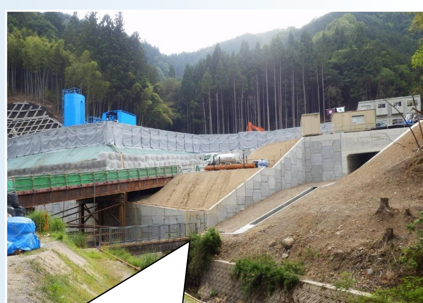
管理用道路には通常の コンクリートパネルを！