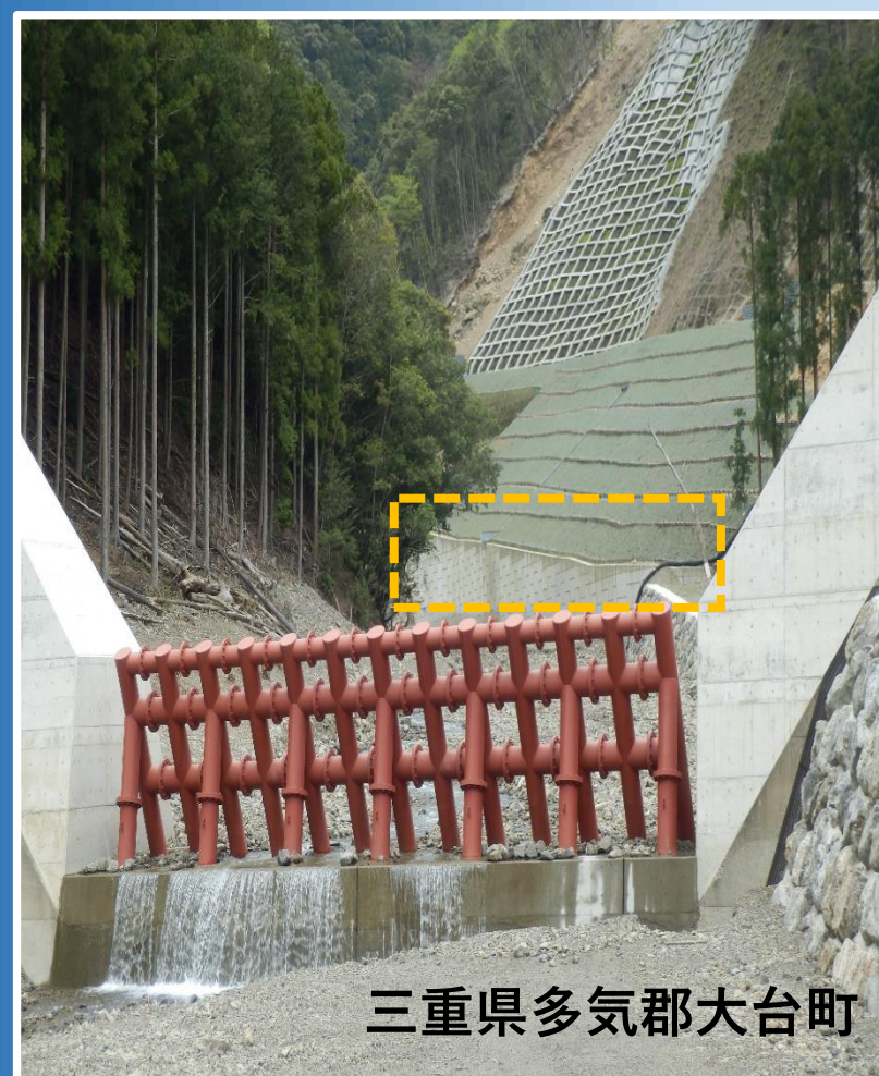
三重県多気郡大台町