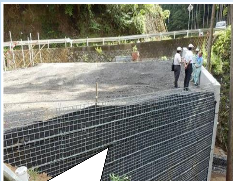
直壁で用地を最小化！ メッシュなら現場での調整が容易