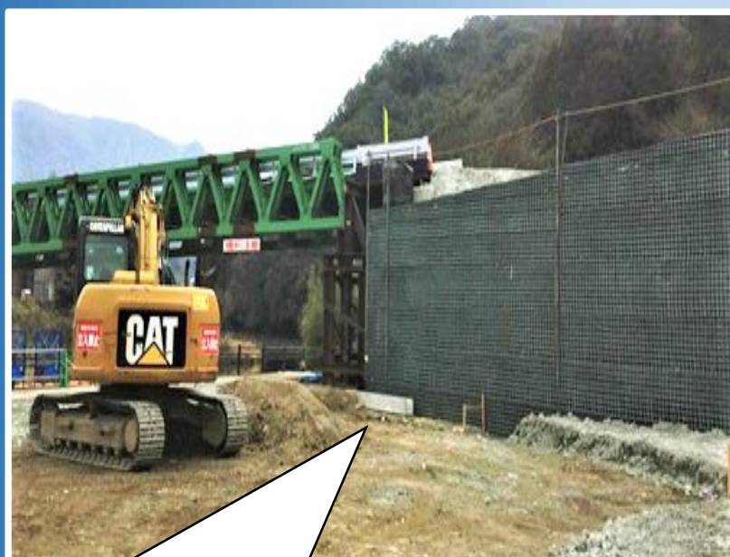
仮橋のアバットにも メッシュパネルで対応！