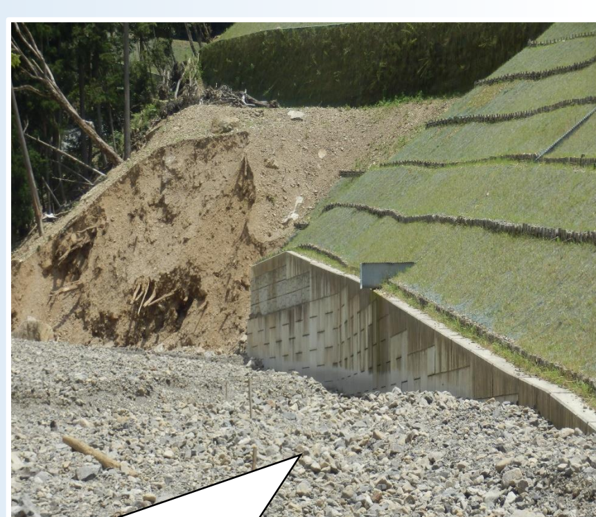
土石流・流木の衝突にさらされ、 半分以上埋まりながらも 問題なく健全性を保った